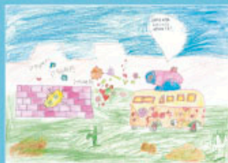
Primer premio primera categoría: Sofía Pires