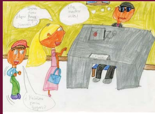
1er Premio 2ª Categoría: Paloma Del Horno Deza